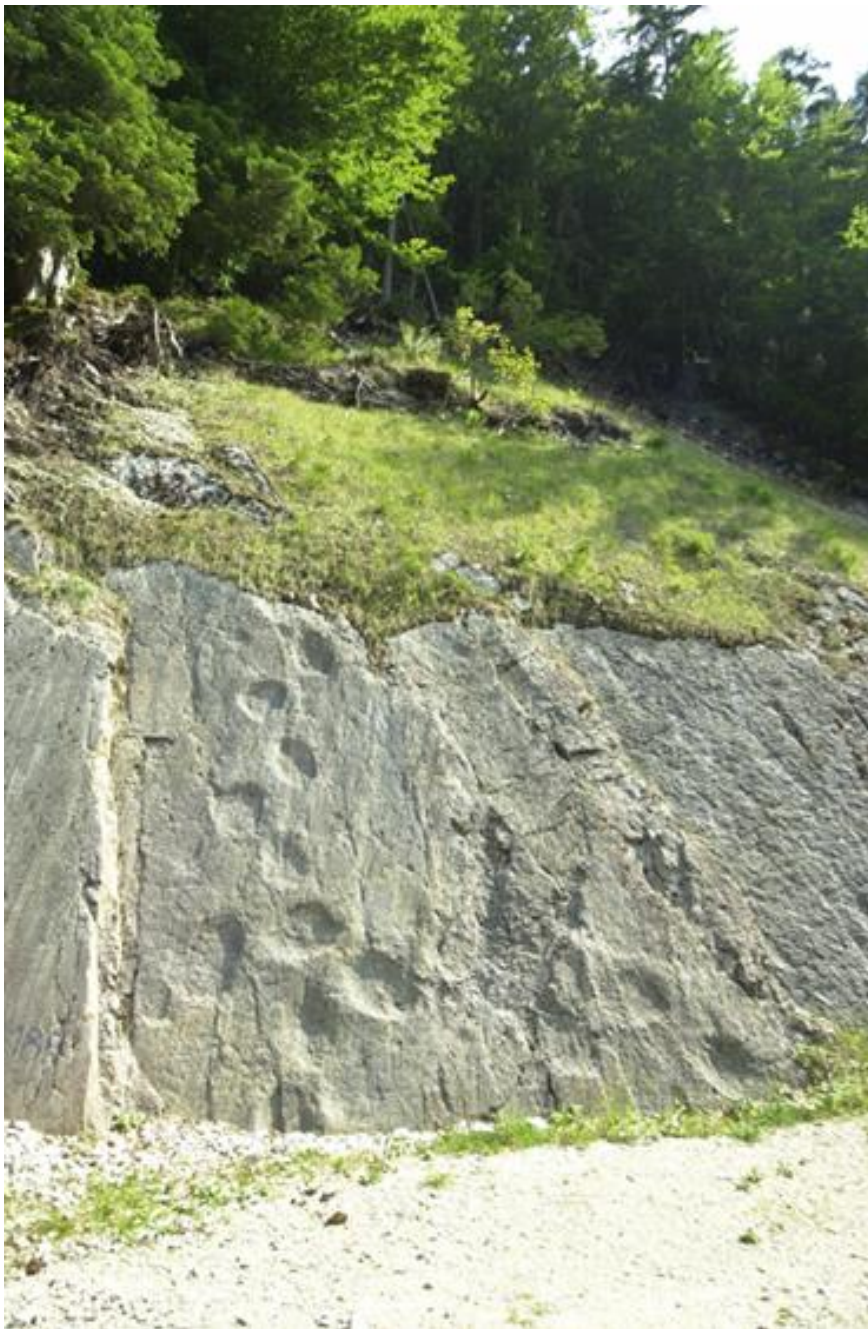
Dinosaurierspuren in einer Felswand, Berner Jura, Schweiz