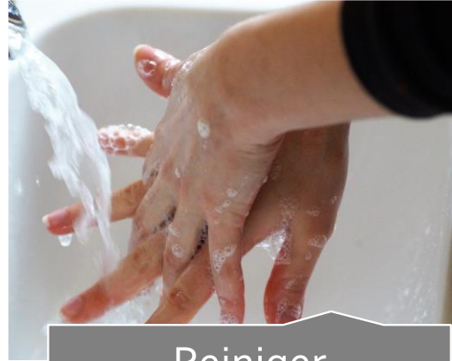
Reiniger Eph 5,26