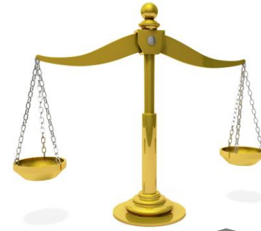
Beurteiler Heb 4,12